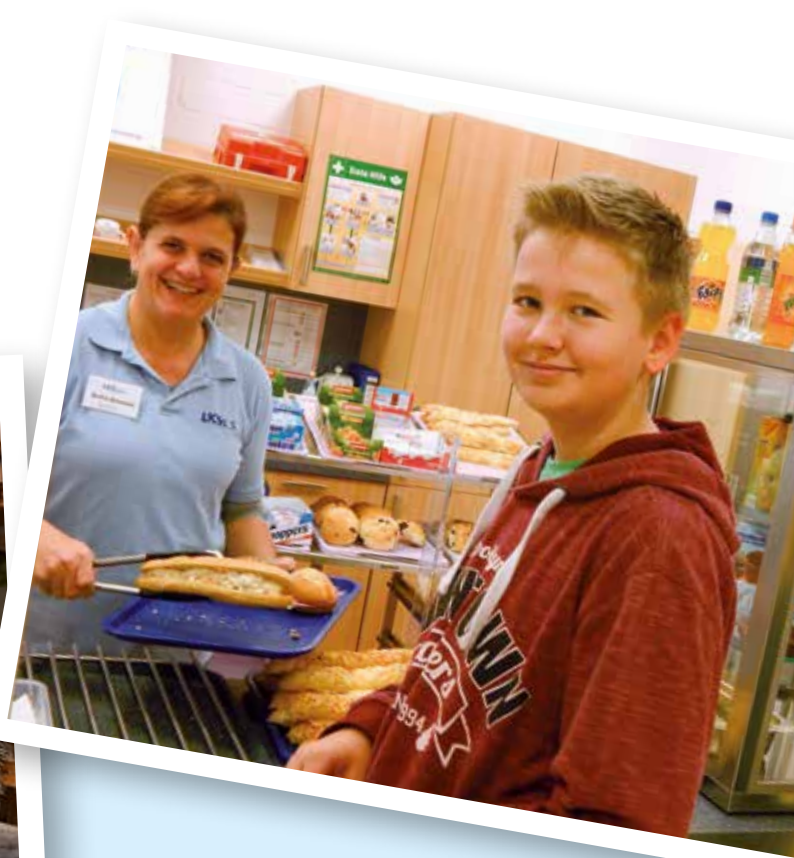
Die Mensa bietet vollwertige Menüs für jeden Geschmack