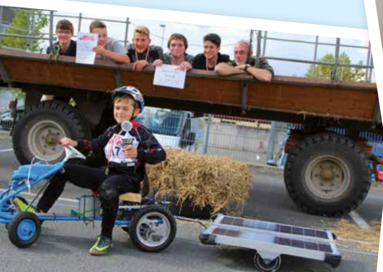
Erfolgreiche Teilnahme am Bobbycar Solarcup

Unser Schulleben ist nicht nur durch Lernen und Arbeiten geprägt, bei uns sammeln die Kinder auch wertvolle Erfahrungen und treffen ihre Freunde. Die Jacobischule ist eine Schule, die von Kindern gerne besucht wird und die auch Raum zum Wohlfühlen bietet. Wir legen großen Wert auf den Ausgleich zwischen Anspannung und Entspannung. Selbstverständlich können sich Kinder in der Schulmensa verpflegen.