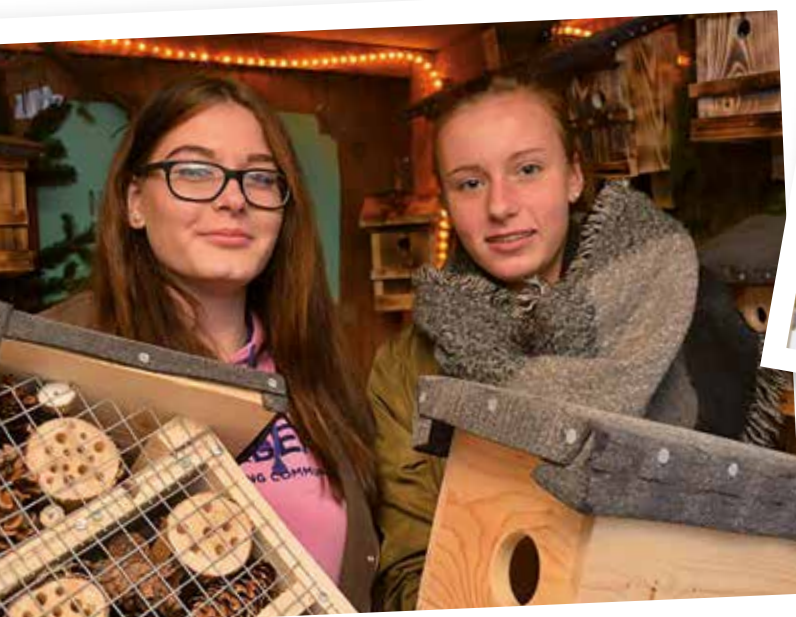
Insektenhotel- und Vogelhäuschenbau mit Verkauf

Seit dem Jahr 2015 ist die Jacobischule mit dem Gütesiegel „Schule der Zukunft“ zertifiziert. Wir erhielten diese Auszeichnung für eine Vielzahl nachhaltiger Projekte, beispielsweise für die Errichtung eines Baumlehrpfads, unserer Apfelsaftproduktion und dem Bau von Nisthilfen unterschiedlichster Art. Bei uns lernen junge Menschen, wie sie eine lebenswerte Zukunft mitgestalten und Verantwortung für sich und ihre Umwelt tragen können.