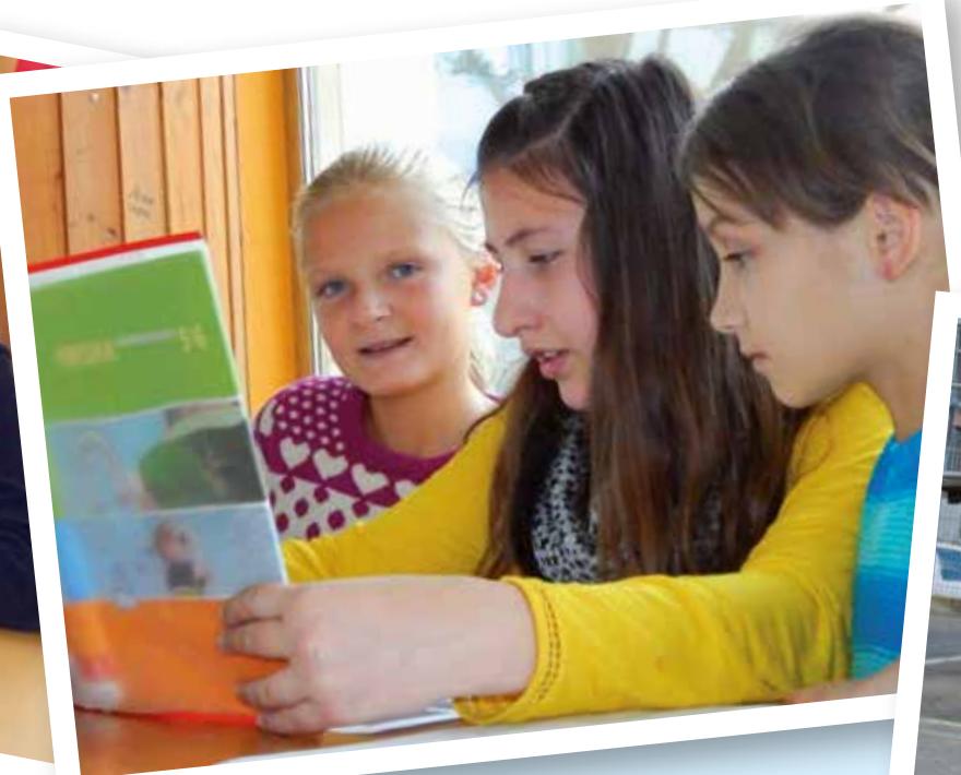
Gemeinsames Lernen mit Spaß